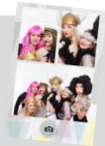
Photos 10x15 cm - Template 1 à 4 photos - GIFs animés - Chroma key